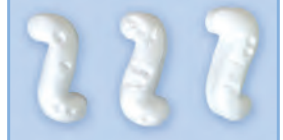
S字状発泡ポリスチレン

形状はS字状であり比較的均一でこれらが互いに絡み合い約50%の空隙を形成します。大きな空隙を作りうることから、優れた透水性を得ることができます。